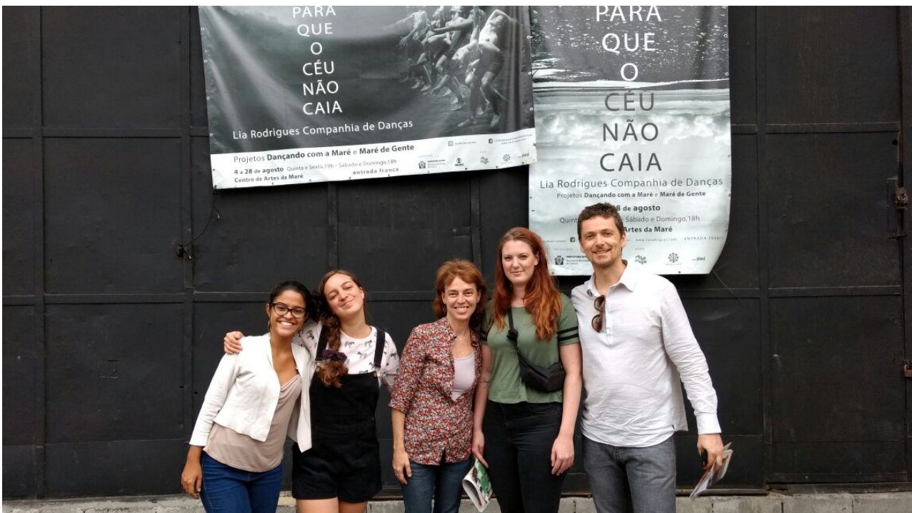
Kaja MANAGEMENT på besøg hos Centro de Artes i farvela'en Maré i Rio de Janeiro sammen med DKI.

Tak til Statens Kunstfond, alle samarbejdspartnere og diverse folk der gav tips og råd undervejs!